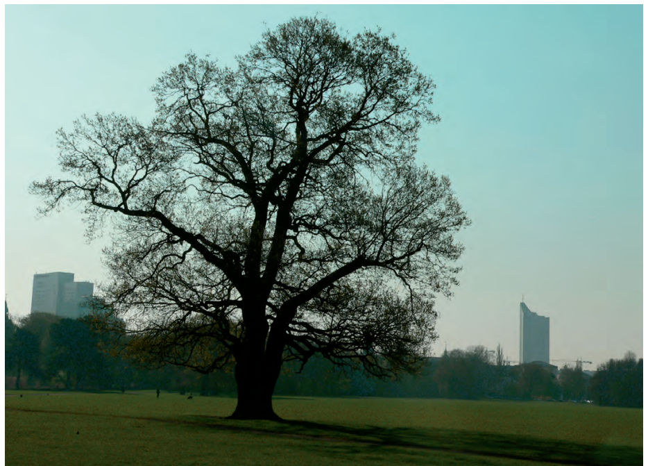
Solitäreiche im Rosental; Diese Eiche bleibt geschützt, doch vielen solcher stattlichen, alten Bäumen auf Wohngrundstücken, Innenhöfen und Gärten wird der Schutz vor Fällung entzogen.